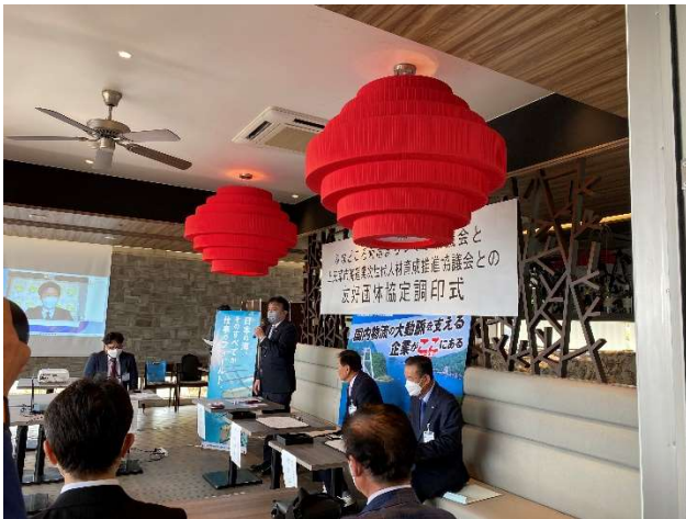
堀江市長（上天草市）挨拶