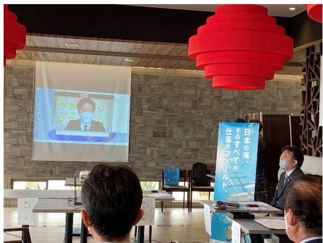
表原市長（阿南市）挨拶