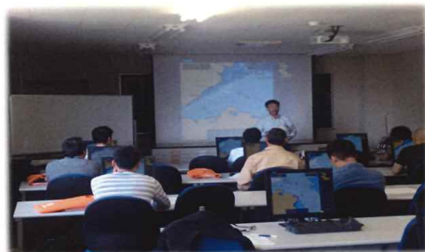
ECDIS の役割とヒューマンエラーを防ぐための BRM に関する座学