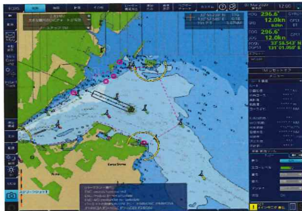
※使用機材：ECDIS FURUNO FMD