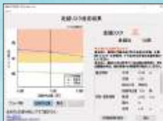
錨鎖長毎 走錨リスク