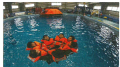
生存技術訓練の様子