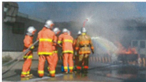
防火・消火訓練の様子