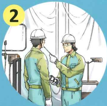
2 リスクアセスメントの実施