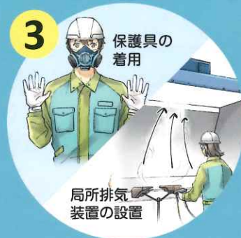
3 リスク低減措置の実施