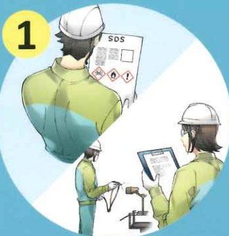
1 SDS及び作業現場の確認

これまで以上に事業者の主体的な取組が求められます ラベル・SDS の伝達やリスクアセスメントの実施がこれまで以上に重要になります