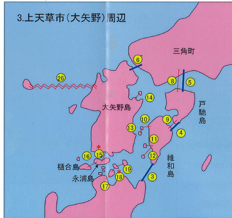
(1) 海峡横断箇所(送電線)